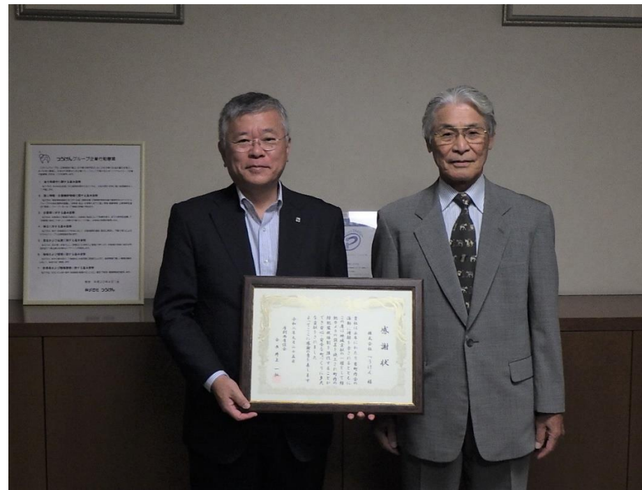
厚別西厚信会 会長様